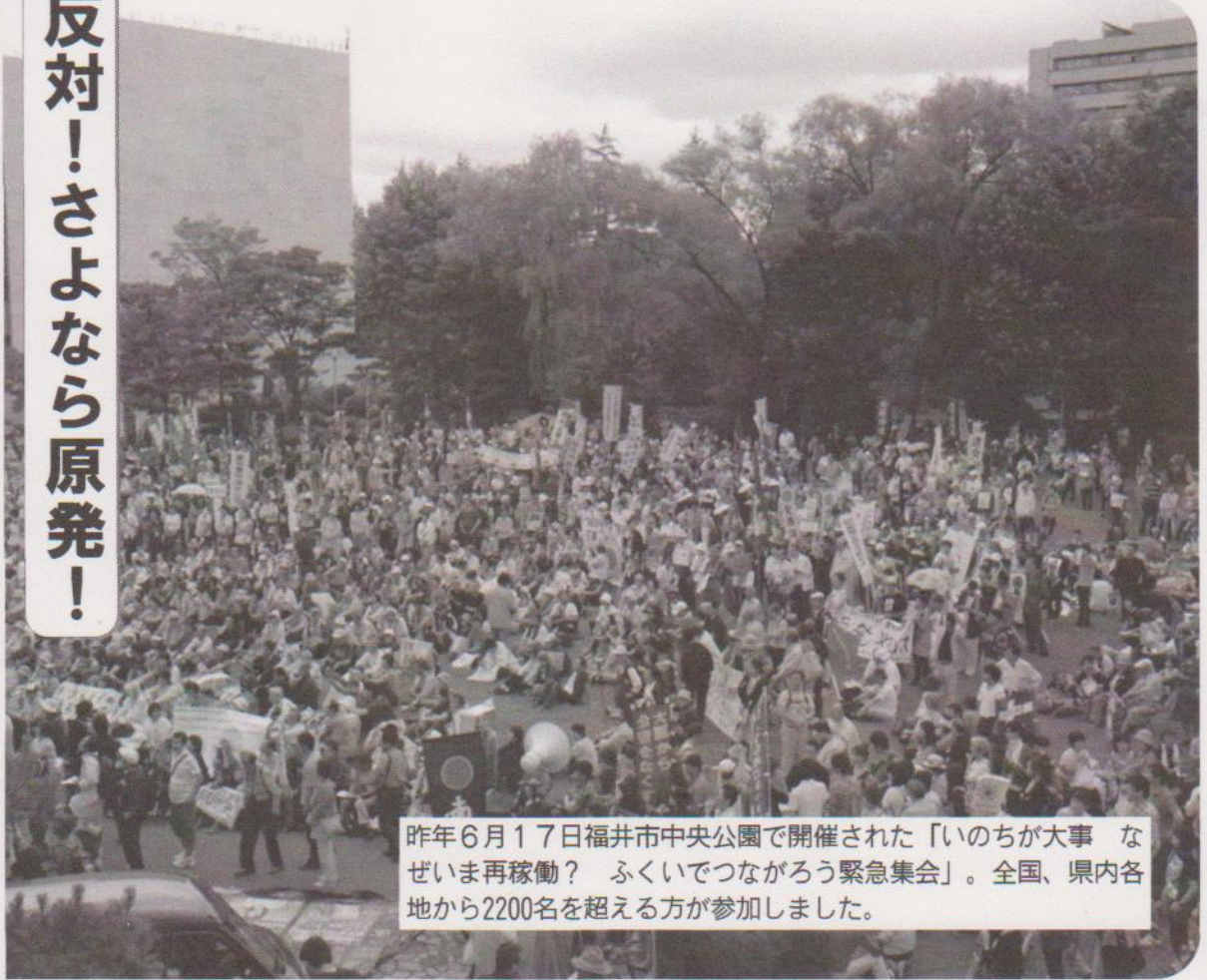
昨年6月17日福井市中央公園で開催された「いのちが大事 なぜいま再稼働？ ふくいでつながろう緊急集会」。全国、県内各地から2200名を超える方が参加しました。

福島原発では大量の汚染水が漏れ続けています。 「収束」どころか「非常事態」です。 こんな時、再稼働や原発輸出など断じて許せません。 この思いを「9.15もう動かすな原発！福井集会」に県内、 全国から持ち寄りましょう。