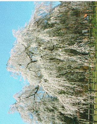
【シダレザクラ】 主幹の根廻り 3.5 m 樹高 12 m 枝張り 東西19 m、南北20 m

約三六〇年間「足羽さんのしだれざくら」として市民に親しまれてきた銘木です。明治三十三年(一九〇〇)の橋南の大火や、昭和二十年の福井空襲の戦下をくぐりぬげ、更には平成十七年十二月十六日、記録的な大雪のため東側の枝二本が折れるなどの受難で一時樹勢も衰えましたが、その後は回復して毎年訪れる人々の目を楽しませていきます。