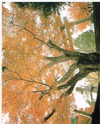
【タカオモミジ】 主幹の幹廻り 3.5 m 樹高 14 m 枝張り 東西12 m、南北14 m

この他にも数種類のカエデが数十本あり、十一月中頃になると真っ赤に境内を染めてくれます。紅葉狩りに訪れる人や、七五三などのご祈禱に来られる人も、境内の錦絵をゆつくりと楽しませていきます。