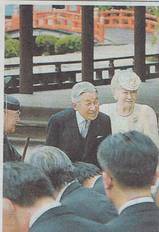
上賀茂神社の参拝を終え、参列者に声をかけられる天皇、皇后両陛下(25日午後、京都市)の撮影

第40回国際外科学会世界総会の開会式に24日に出席し、引き続き京都市に滞在している天皇、皇后両陛下は25日、下鴨神社と上賀茂神社を私的に参拝された。